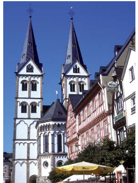
Boppard – St. Severuskirche

Bonn : Stadtrundgang, u.a. vorbei am Beethovenhaus, und Besichtigung des Münsters, einem bedeutenden Denkmal der rheinischen Geschichte mit seinem romanischen Kreuzgang. Danach Fahrt auf die andere Rheinseite und Besichtigung der 1151 geweihten Doppelkirche