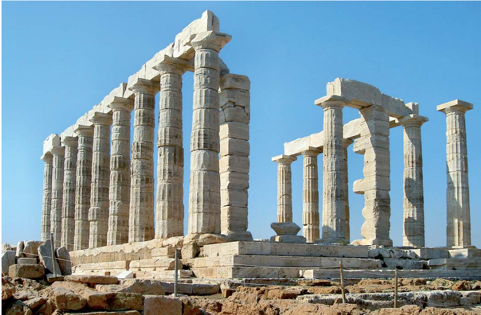
Kap Sounion – Poseidontempel