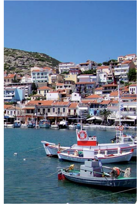
Pythagorio auf Samos