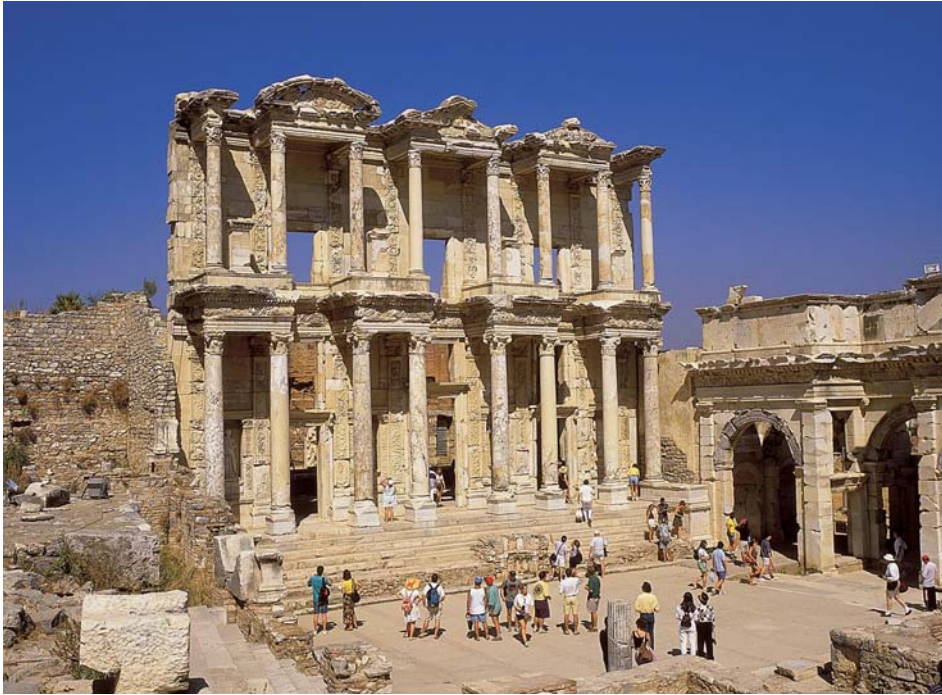
Ephesus – Celsusbibliothek